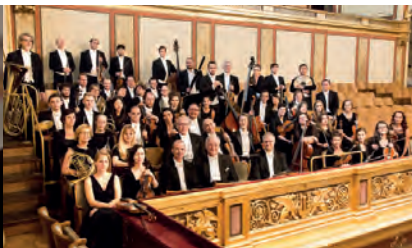
Orchestra Wiener Akademie