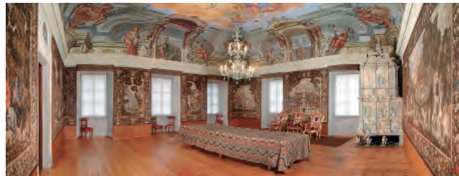
Hofburg Bressanone, sala imperiale