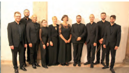
Solisti vocali dell' Ensemble Quadriga Musica