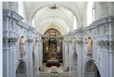
Abbazia Monte Maria, Chiesa conventuale