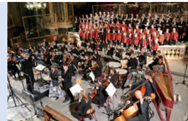
I Wiltener Sängerknaben nel Duomo di Bressanone