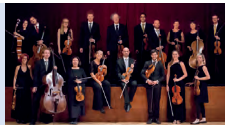
Accademia d'archi Bolzano