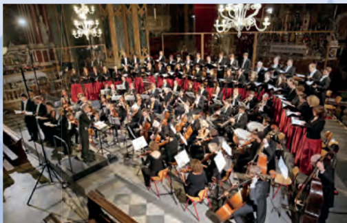
Kammerchor e Hofkapelle Stuttgart nel Duomo di Bressanone

Secondo gli scienziati tedeschi Aleida e Jan Assmann, il concetto di memoria culturale definisce quella "nostra tradizione che dà forma sia alla coscienza umana di tempo e storia, sia all'immagine del proprio sé nel mondo e che si crea nel corso di molte generazioni tramite testi, immagini e riti che si ripetono per centinaia o migliaia di anni".