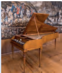
Il fortepiano dall'epoca di Mozart